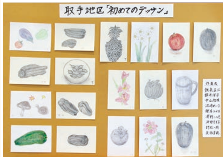
JA女性部 取手地区の作品 (3p)